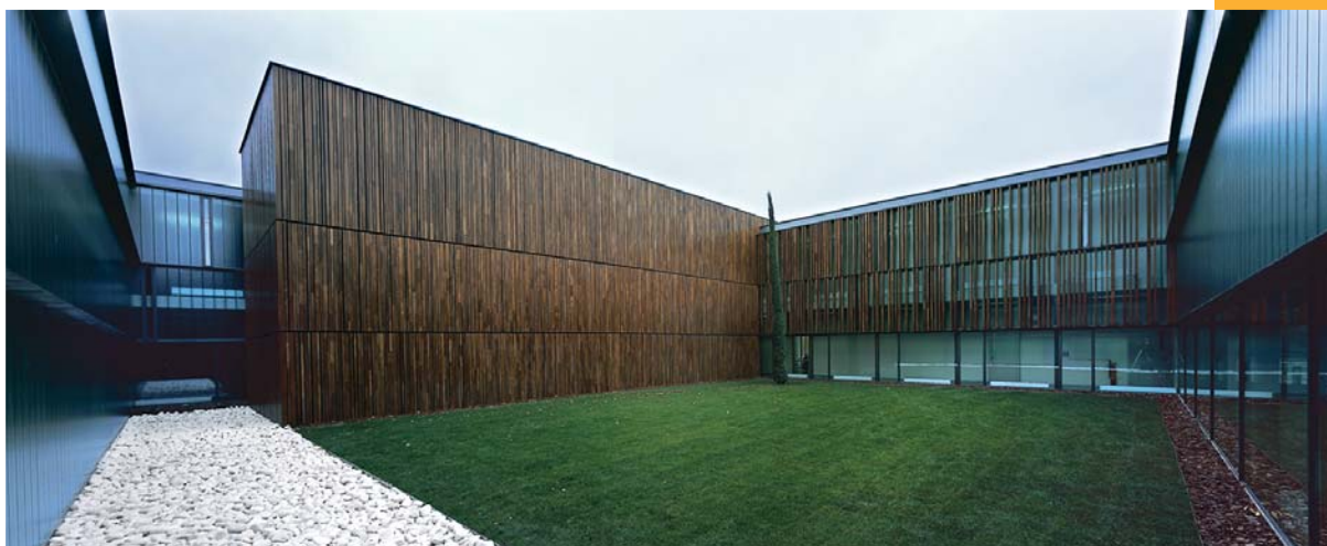
Foro Europeo Campus Empresarial de Huarte. Sede del Programa Avanzado de Empresa Familiar (Ed. Navarra)